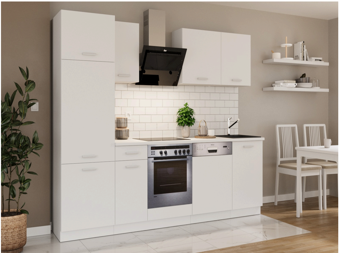
Zestaw mebli TORRES 270 cm