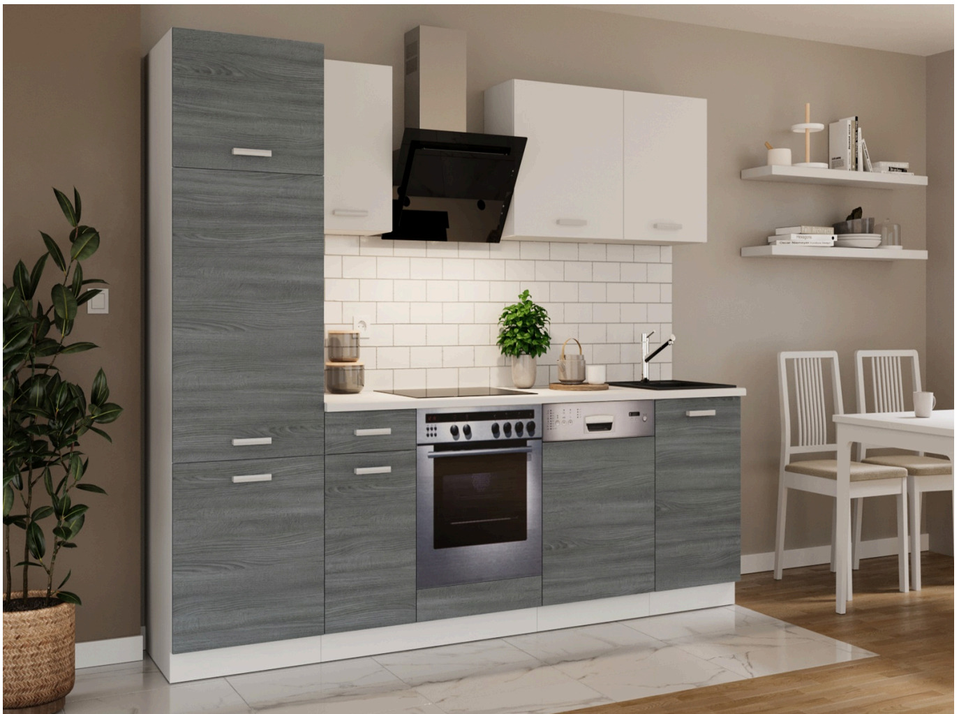
Zestaw mebli TORRES 270 cm