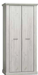
AP16 107x56x198 cm opcja dodatkowych półek