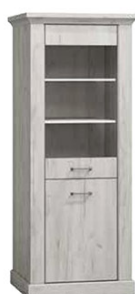
AP11 67x42x198 cm opcja LED półki