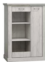
AP12 97x42x40.5 cm opcja LED półki