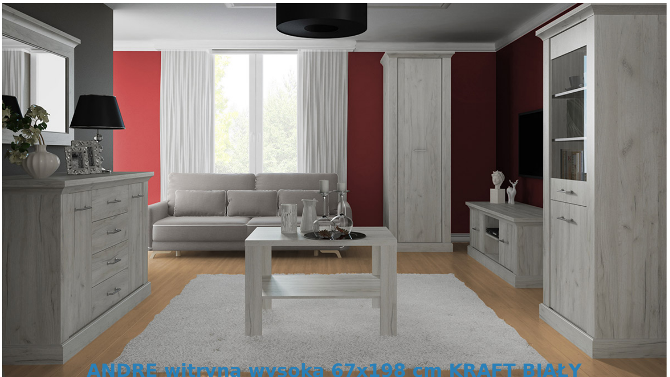
ANDRE witryna wysoka 67x198 cm KRAFT BIAŁY

Stylowa przeszklona witryna wysoka z szafkami oraz półkami o szerokości 67 cm należąca do systemu ANDRE. Możliwość dokupienia oświetlenia LED - zakładka "akcesoria". Subtelny wygląd przypominający antyczne kształty kolumn greckich. Jasny kolor kraft biały dodaje ciepłego charakteru. Meble wykonane z wysokiej jakości płyty laminowanej o grubości 16mm, blaty pogrubione do 48mm. Obrzeża wykończone trwałą okleiną PCV. System posiada frezowane listwy wykonane z MDF. Szuflady na prowadnicach kulkowych z pełnym wysuwem. Całość zdobią metalowe uchwyty. Meble pakowane w paczki, do samodzielnego montażu. Do kompletu dołączona przejrzysta instrukcja montażu. Produkt w 100% polski.