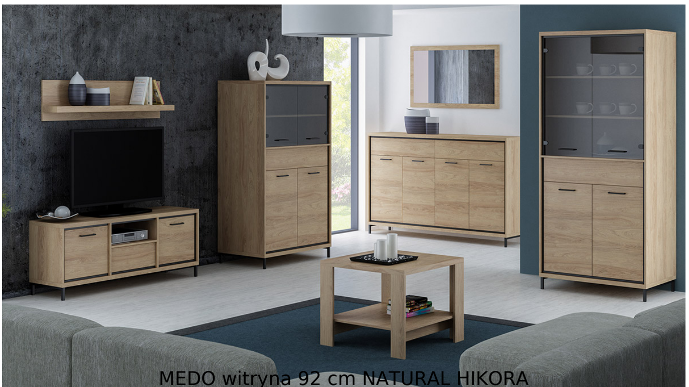
MEDO witryna 92 cm NATURAL HIKORA

Prosta i funkcjonalna witryna z półkami oraz szufladą o szerokości 92 cm należąca do systemu MEDO. Możliwość dokupienia oświetlenia LED do półek oraz pod blat. Jasny kolor natural hikora dodaje ciepłego charakteru. Meble wykonane z wysokiej jakości płyty laminowanej o grubości 16mm, blaty pogrubione do 32mm. Obrzeża wykończone trwałą okleiną PCV. System posiada ramkę ozdobną w kolorze czarnym z MDF oraz system cichego domykania. Szuflady na prowadnicach kulkowych z pełnym wysuwem oraz funkcją "push to open". Całość zdobią metalowe uchwyty. Meble pakowane w paczki, do samodzielnego montażu. Do kompletu dołączona przejrzysta instrukcja montażu. Produkt w 100% polski.