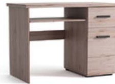
K07 90 lub 105/75/56