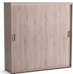
K13 120 lub 200/204/60