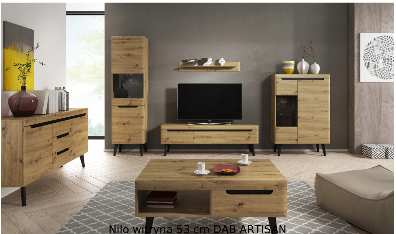
Nilo witryna 53 cm DĄB ARTISAN

Witryna o szerokości 53 cm należąca do serii Nilo. Możliwość zakupu witryny z oświetleniem LED. Kolekcja NILO to Niecodzienne połączenie dębu z ciemnym dekiem i wysoką nogą o kształcie nawiązującym do formy frontów zaskoczy twoje wnętrze. Mnogość elementów w kolekcji sprawi, że nigdy nie zabraknie pomysłu na ciekawe aranżacje. Subtelny charakter formy podkreślony przez zmiękczenia krawędzi, pozwoli nabrać Twojemu wnętrzu lekkości i świeżego spojrzenia. Pozwól się zaskoczyć, wybierając NILO. Meble wykonane z wysokiej jakości płyty, listwy oraz fronty z płyty MDF, korpus oklejony obrzeżem ABS, elementy wykończone drewnem. Wybrane elementy zestawu dostępne z oświetleniem LED. Meble pakowane