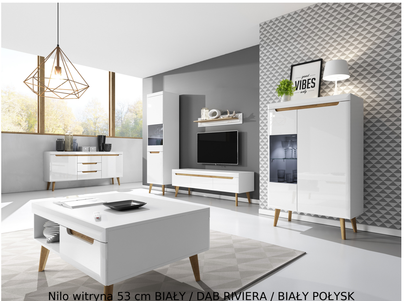
Nilo witryna 53 cm BIAŁY / DĄB RIVIERA / BIAŁY POŁYSK