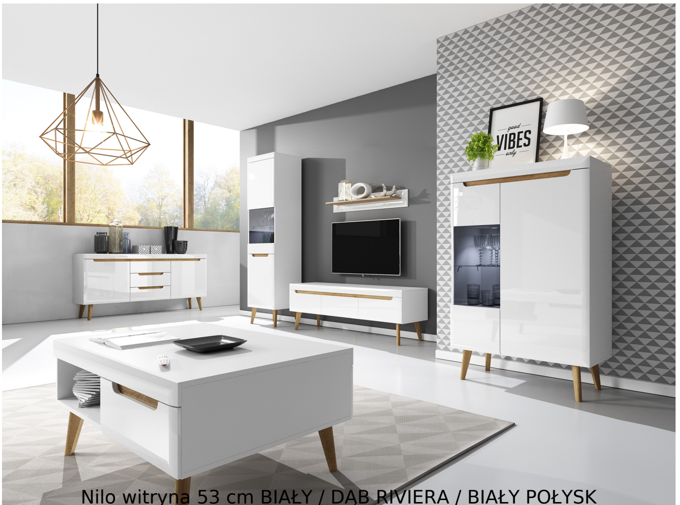
Nilo witryna 53 cm BIAŁY / DĄB RIVIERA / BIAŁY POŁYSK