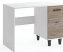
Biuurko B5 100/75/56