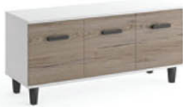
Szafka RTV B4 120/42/40