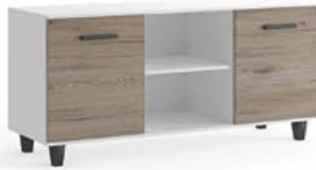
Komoda B2 160/80/40