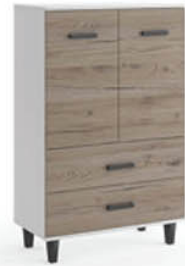
Komoda B3 80/122/40