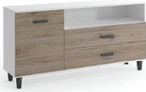
Komoda B1 120/80/40