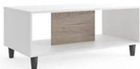
Stolik B10 100/50/55