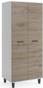
Szafa B7 80/183/56