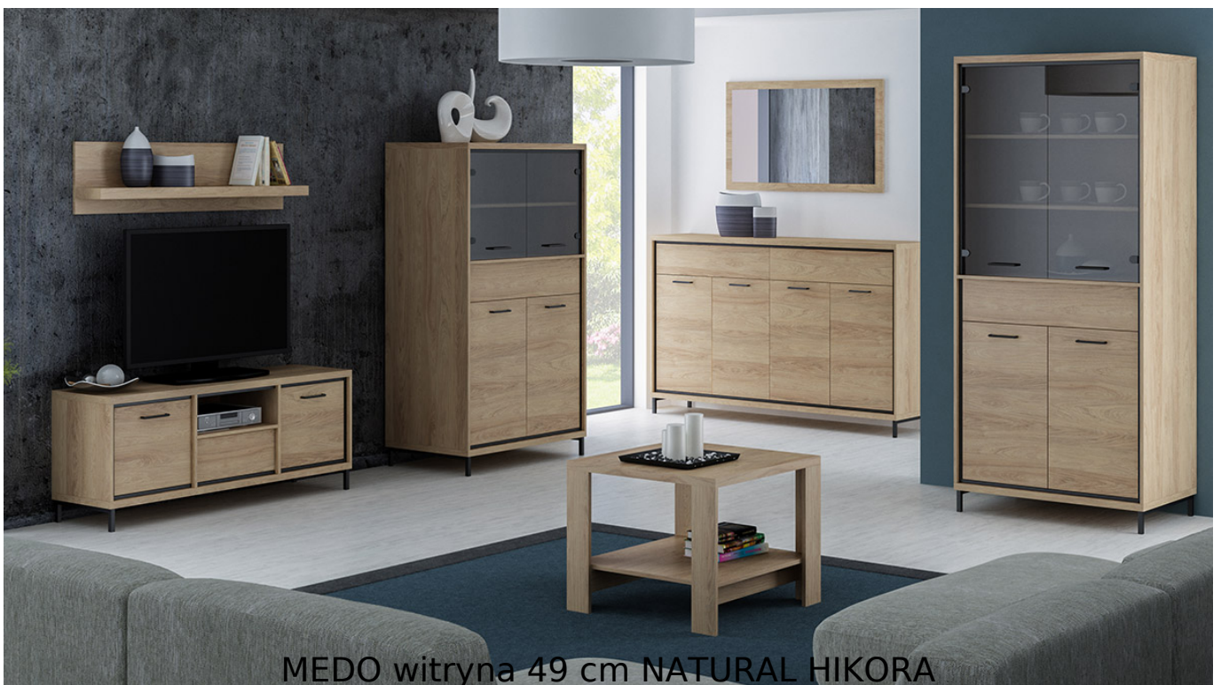
MEDO witryna 49 cm NATURAL HIKORA

Prosta i funkcjonalna witryna z półkami oraz szufladą o szerokości 49 cm należąca do systemu MEDO. Możliwość dokupienia oświetlenia LED do półek oraz pod blat. Jasny kolor natural hikora dodaje ciepłego charakteru. Meble wykonane z wysokiej jakości płyty laminowanej o grubości 16mm, blaty pogrubione do 32mm. Obrzeża wykończone trwałą okleiną PCV. System posiada ramkę ozdobną w kolorze czarnym z MDF oraz system cichego domykania. Szuflady na prowadnicach kulkowych z pełnym wysuwem oraz funkcją "push to open". Całość zdobią metalowe uchwyty. Meble pakowane w paczki, do samodzielnego montażu. Do kompletu dołączona przejrzysta instrukcja montażu. Produkt w 100% polski.