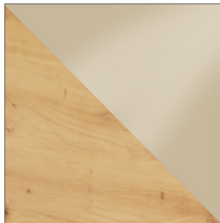
ARTISAN / KREM POŁYSK