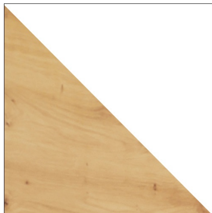
ARTISAN / BIAŁY POŁYSK