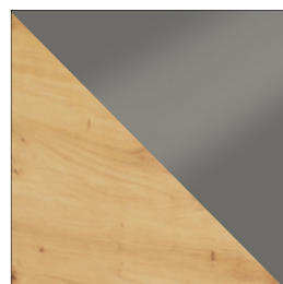
ARTISAN / SZARY POŁYSK