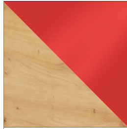
ARTISAN / CZERWONY POŁYSK