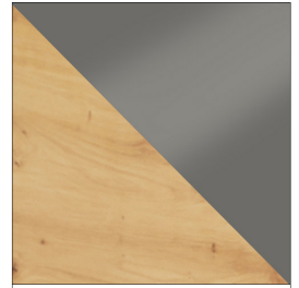
ARTISAN / SZARY POŁYSK