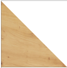
ARTISAN / BIAŁY POŁYSK