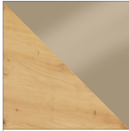
ARTISAN / CAPPUCCINO POŁYSK