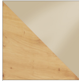
ARTISAN / KREM POŁYSK