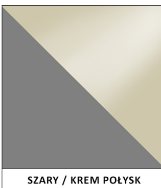
SZARY / KREM POŁYSK