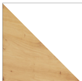
ARTISAN / BIAŁY POŁYSK