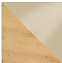
ARTISAN / KREM POŁYSK