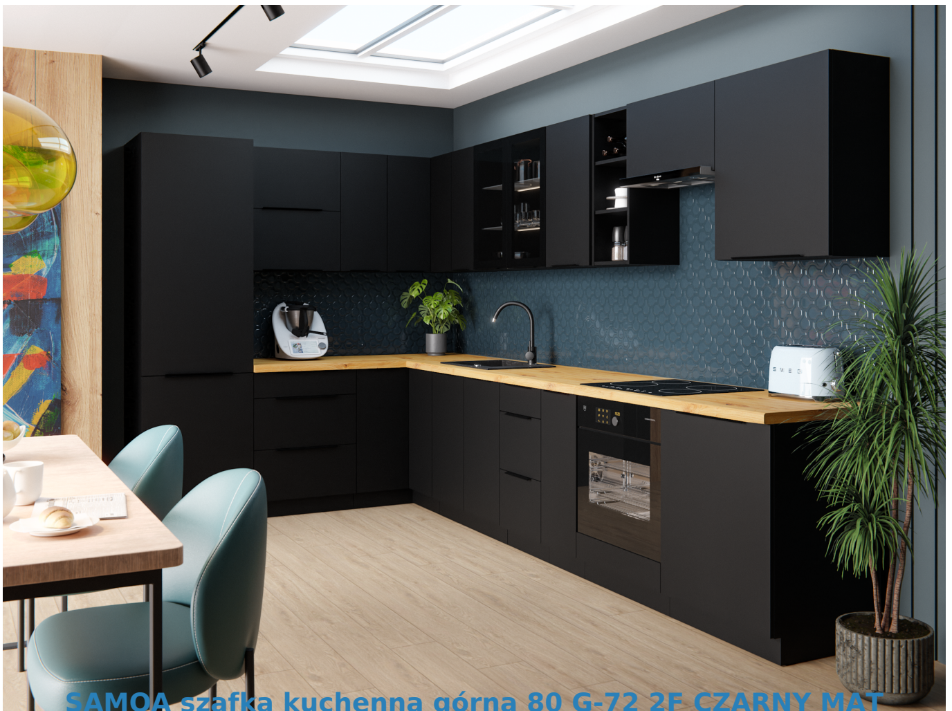
SAMOA szafka kuchenna górna 80 G-72 2F CZARNY MAT