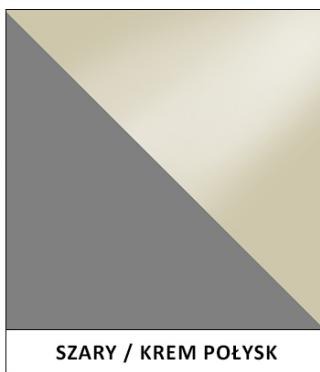
SZARY / KREM POŁYSK