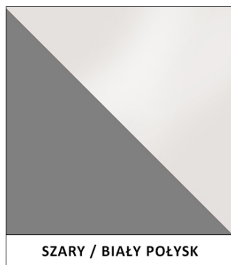
SZARY / BIAŁY POŁYSK