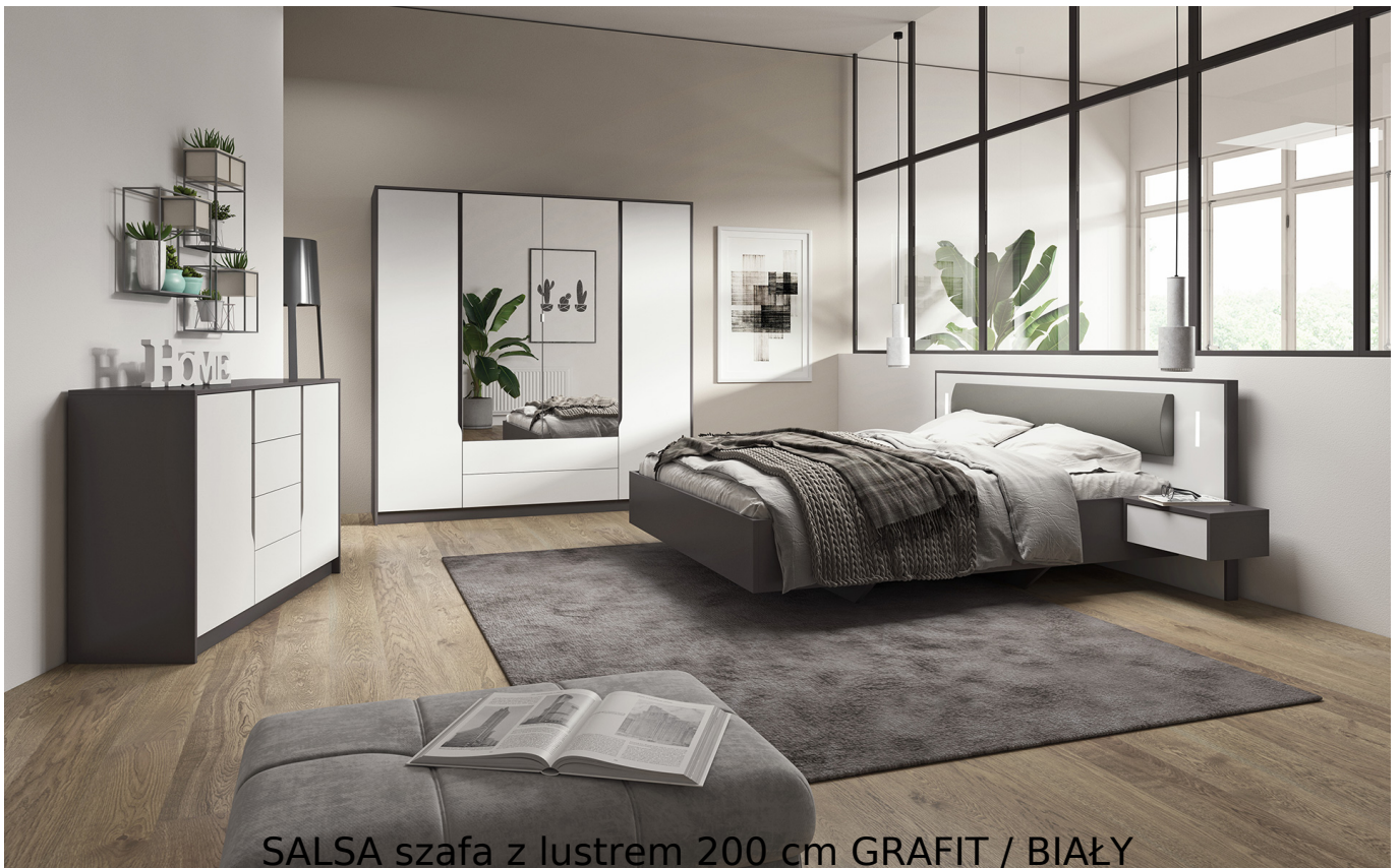
SALSA szafa z lustrem 200 cm GRAFIT / BIAŁY

Nowoczesna szafa 4-drzwiowa z lustrem należąca do systemu SALSA. Kolekcja do sypialni Salsa to odważne wzornictwo w kontrastowej kolorystyce. Stwórz sypialnię z pomysłem i ciesz się oryginalną, nowoczesną przestrzenią. Meble wykonane z wysokiej jakości płyty, listwy z płyty MDF, korpus oklejony obrzeżem ABS. Meble pakowane w paczki, do samodzielnego montażu. Do kompletu dołączona przejrzysta instrukcja montażu. Produkt w 100% polski.