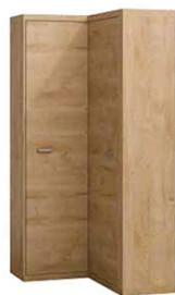
N14 87/109x53,5/40,5x200,5 cm