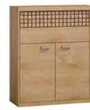
N6 102x40,5x118,5 cm opcja LED blat