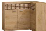
N15 132/95,5x40,5x99 cm opcja LED blat