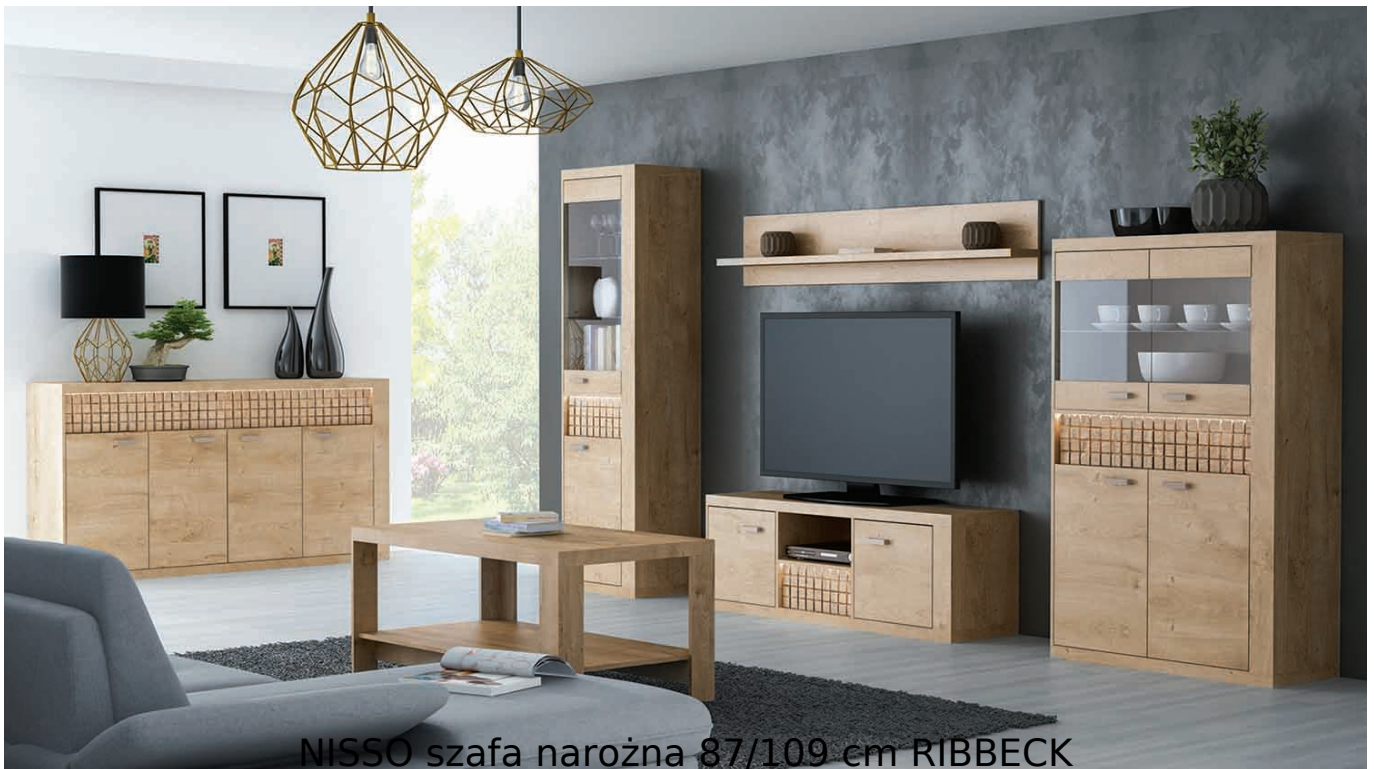
NISSO szafa narożna 87/109 cm RIBBECK

Szafa narożna 2-drzwiowa szerokości 87/109 cm należąca do systemu NISSO. Ultranowoczesny wygląd stworzonej kolekcji, to pomysł zarówno na salon jak i sypialnię. Połączenie prostoty kształtów oraz artystycznego akcentu dla lubiących bardzo innowacyjny wygląd w zestawieniu z praktycznością. Fronty szuflad dostępne w stylu NATURAL KRATKA lub NATURAL FALA. Meble pakowane w paczki, do samodzielnego montażu. Do kompletu dołączona przejrzysta instrukcja montażu. Produkt w 100% polski.