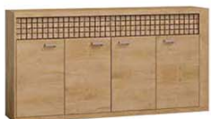
N9 191,5x40,5x99 cm opcja LED blat