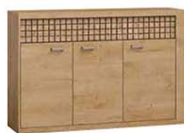
N8 146,5x40,5x99 cm opcja LED blat