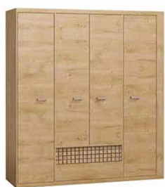
N3 195,5x57,5x200,5 cm opcja LED blat