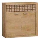
N7 102x40,5x99 cm opcja LED blat