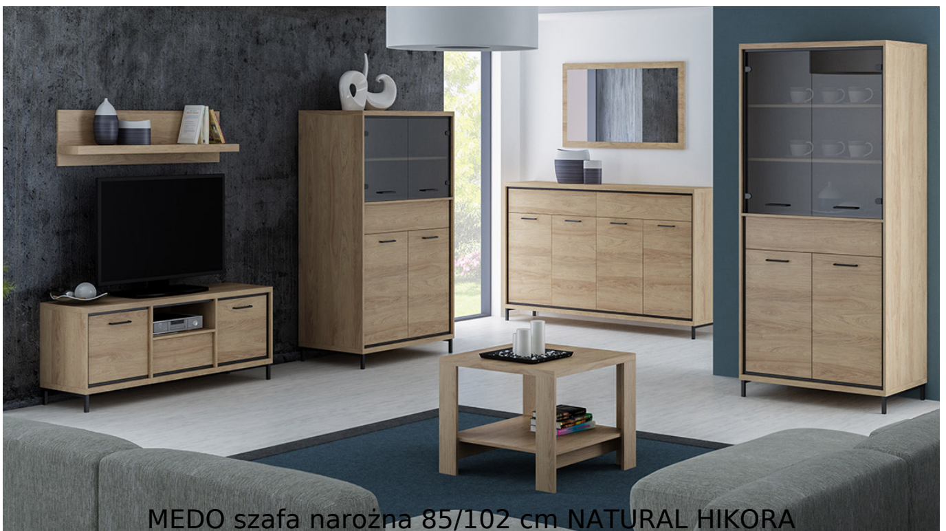
MEDO szafa narożna 85/102 cm NATURAL HIKORA

Prosta i funkcjonalna szafa narożna z drążkiem na wieszaki o szerokości 85-102 cm należąca do systemu MEDO. Możliwość dokupienia do szafy nóg metalowych. Jasny kolor natural hikora dodaje ciepłego charakteru. Meble wykonane z wysokiej jakości płyty laminowanej o grubości 16mm, blaty pogrubione do 32mm. Obrzeża wykończone trwałą okleiną PCV. System posiada ramkę ozdobną w kolorze czarnym z MDF oraz system cichego domykania. Szuflady na prowadnicach kulkowych z pełnym wysuwem oraz funkcją "push to open". Całość zdobią metalowe uchwyty. Meble pakowane w paczki, do samodzielnego montażu. Do kompletu dołączona przejrzysta instrukcja montażu. Produkt w 100% polski.