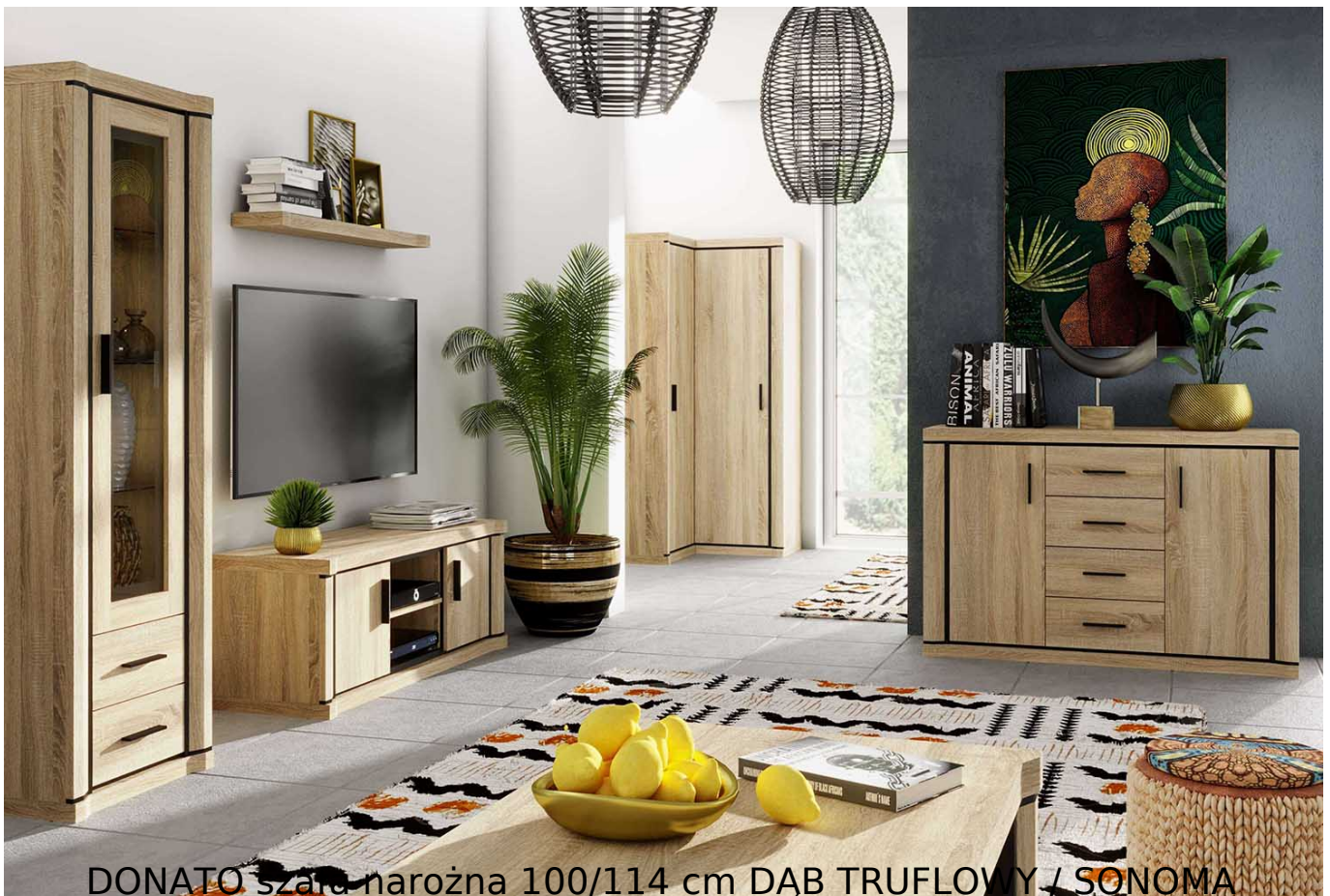
DONATO szafa narożna 100/114 cm DĄB TRUFLOWY / SONOMA

Szafa narożna 2-drzwiowa o szerokości 100/114 cm należąca do systemu DONATO. Inspirujący system livingowy, sypialniany z charakterystycznym obramowaniem na frontach. Bardzo efektowny i funkcjonalny. Sprawdzi się również jako system przy