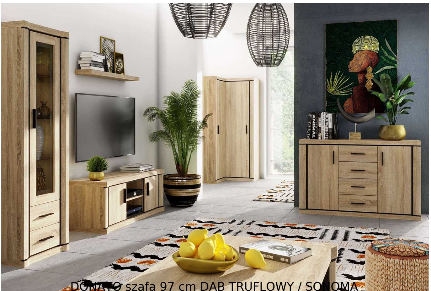
DONATO szafa 97 cm DĄB TRUFLOWY / SONOMA

Szafa 2-drzwiowa z szufladą o szerokości 97 cm należąca do systemu DONATO. Możliwość dokupienia dodatkowych półek. Inspirujący system livingowy, sypialniany z charakterystycznym obramowaniem na frontach. Bardzo efektowny i