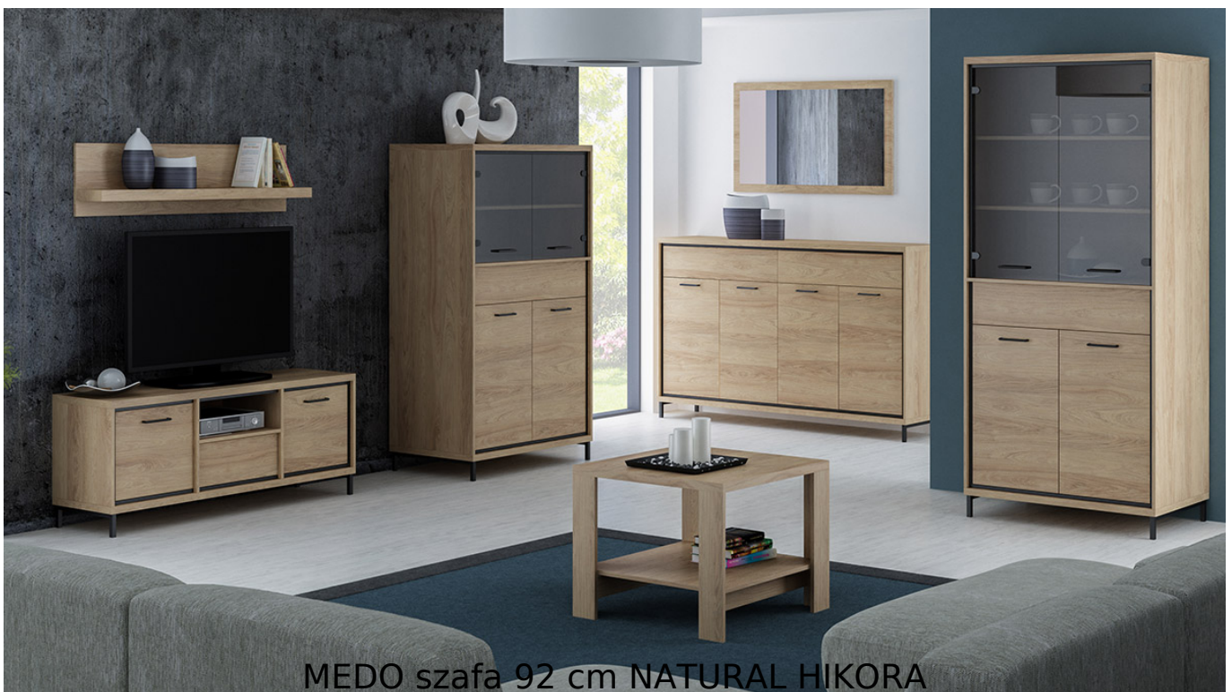
MEDO szafa 92 cm NATURAL HIKORA

Prosta i funkcjonalna szafa z drążkiem na wieszaki o szerokości 92 cm należąca do systemu MEDO. Możliwość dokupienia do szafy dodatkowych półek zamiast drążka na wieszaki oraz i nóg metalowych. Jasny kolor natural hickora dodaje ciepłego charakteru. Meble wykonane z wysokiej jakości płyty laminowanej o grubości 16mm, blaty pogrubione do 32mm. Obrzeża wykończone trwałą okleiną PCV. System posiada ramkę ozdobną w kolorze czarnym z MDF oraz system cichego domykania. Szuflady na prowadnicach kulkowych z pełnym wysuwem oraz funkcją "push to open". Całość zdobią metalowe uchwyty. Meble pakowane w paczki, do samodzielnego montażu. Do kompletu dołączona przejrzysta instrukcja montażu. Produkt w 100% polski.