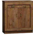
T2 90x44x110 cm