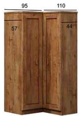
T25 KATALOG 95/110x57/44x190 cm (dostępna wersja odwrotna)