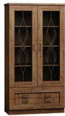
T8 90x44x190 cm opcja pełny front