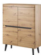
KOMODA 107 / 134 / 40 cm