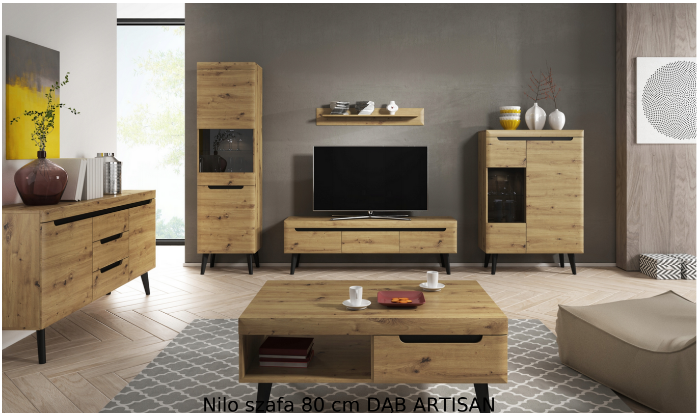
Nilo szafa 80 cm DĄB ARTISAN

Szafa o szerokości 80 cm należąca do serii Nilo. Kolekcja NILO to Niecodzienne połączenie dębu z ciemnym dekiem i wysoką nogą o kształcie nawiązującym do formy frontów zaskoczy twoje wnętrze. Mnogość elementów w kolekcji sprawi, że nigdy nie zabraknie pomysłu na ciekawe aranżacje. Subtelny charakter formy podkreślony przez zmiękczenia krawędzi, pozwoli nabrać Twojemu wnętrzu lekkości i świeżego spojrzenia. Pozwól się zaskoczyć, wybierając NILO. Meble wykonane z wysokiej jakości płyty, listwy oraz fronty z płyty MDF, korpus oklejony obrzeżem ABS, elementy wykończone drewnem. Wybrane elementy zestawu dostępne z oświetleniem LED. Meble pakowane w paczki do samodzielnego montażu z załączoną instrukcją. Produkt