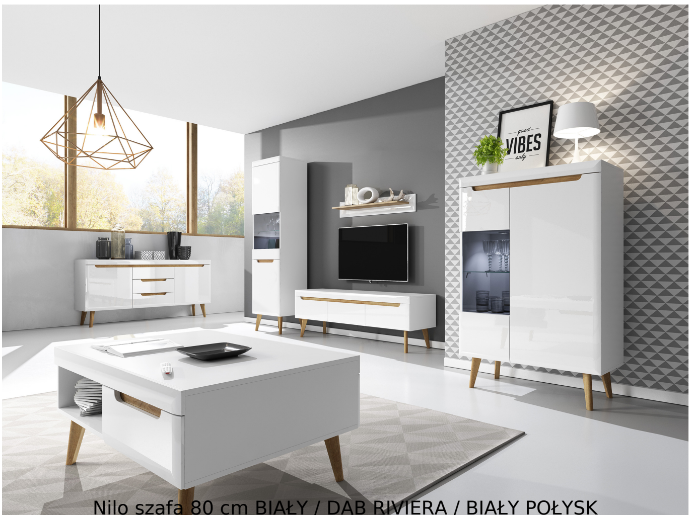
Nilo szafa 80 cm BIAŁY / DĄB RIVIERA / BIAŁY POŁYSK