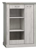
AP12 97x42x140,5 cm opcja LED półki