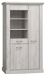
AP10 97x42x198 cm opcja LED półki