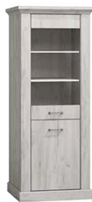
AP11 67x42x198 cm opcja LED półki