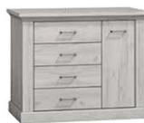
AP2 114x42x95,5 cm