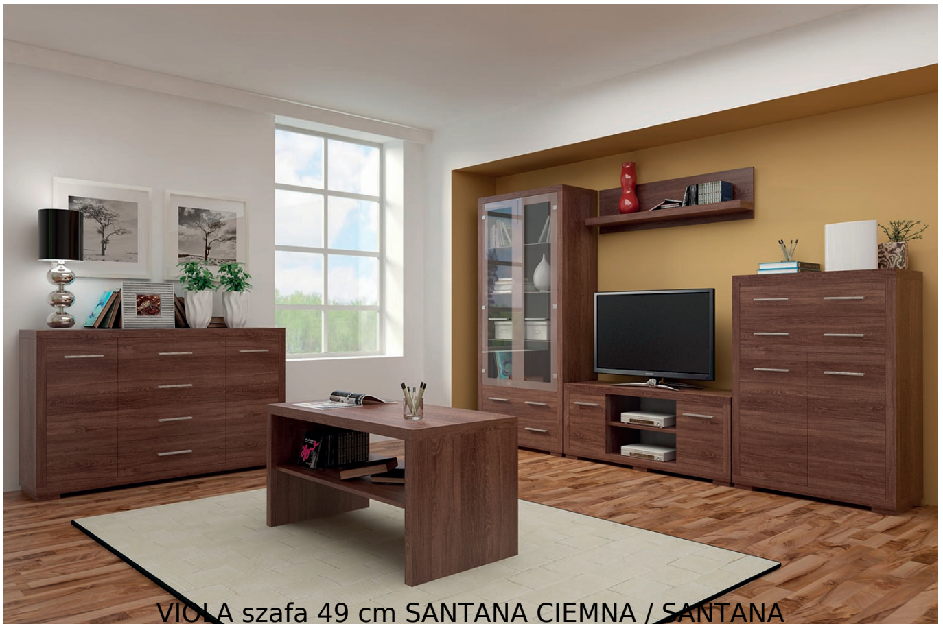
VIOLA szafa 49 cm SANTANA CIEMNA / SANTANA

Szafa 1-drzwiowa z drążkiem na wieszaki o szerokości 49 cm należąca do kolekcji Viola. Możliwość dokupienia dodatkowych półek zamiast drążka na wieszaki. System jest idealnym rozwiązaniem dla każdego biura i salonu. Dzięki