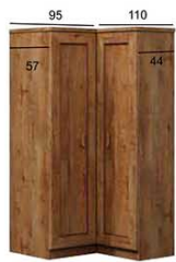
T25 KATALOG 95/110x57/44x190 cm (dostępna wersja odwrotna)