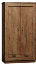
T7 90x57x190 cm opcja trzech półek