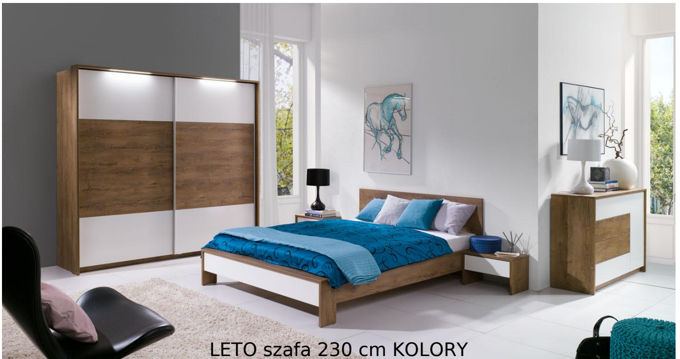
LETO szafa 230 cm KOLORY

Szafa 2-drzwiowa przesuwana z półkami, szufladami oraz drążkami na wieszaki należąca do kolekcji LETO. Kolekcja mebli do sypialni w kolorystyce dąb burgundzki/biały, dąb burgundzki/popiel oraz dąb riviera/biały. Funkcjonalne rozwiązania zapewniają wygodne i komfortowe miejsce do odpoczynku. Meble wykonane z wysokiej jakości płyty, korpus oklejony obrzeżem ABS. Meble pakowane w paczki, do samodzielnego montażu. Do kompletu dołączona przejrzysta instrukcja montażu. Produkt w 100% polski.