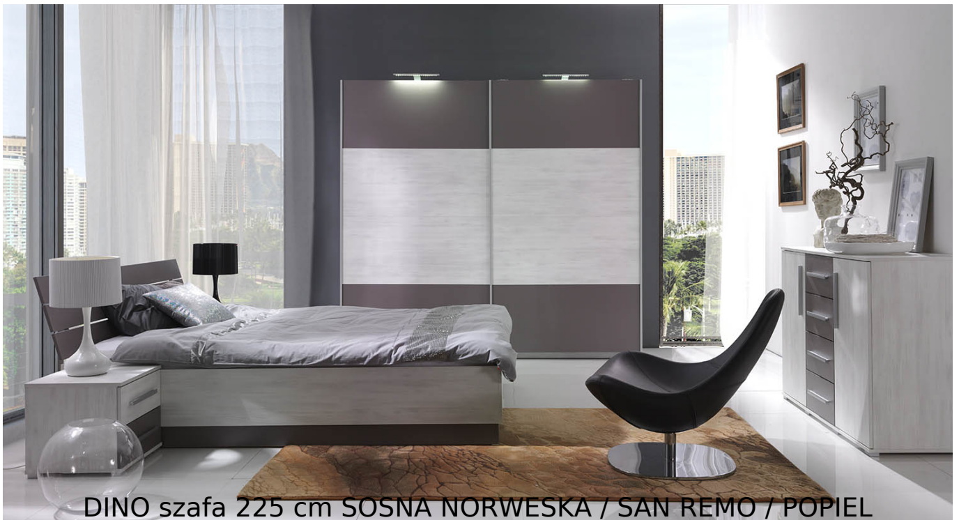
DINO szafa 225 cm SOSNA NORWESKA / SAN REMO / POPIEL

Szafa 2-drzwiowa przesuwna z półkami oraz drążkami na wieszaki należąca do kolekcji DINO. Szafa dostępna w trzech wariantach (bez luster, 4 panele luster, 8 paneli luster) . Kolekcja mebli do sypialni w kolorystyce sosna norweska/popiel lub san remo/popiel. Funkcjonalne rozwiązania zapewniają wygodne i komfortowe miejsce do odpoczynku. Meble wykonane z wysokiej jakości płyty, korpus oklejony obrzeżem ABS. Meble pakowane w paczki, do samodzielnego montażu. Do kompletu dołączona przejrzysta instrukcja montażu. Produkt w 100% polski.