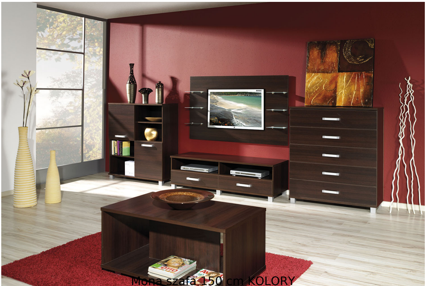
Mona szafa 150 cm KOLORY

Szafa 3-drzwiowa z półkami oraz drążkami na wieszaki należąca do kolekcji Mona. Kolekcja mebli do salonu, sypialni oraz pokoju młodzieżowego. System dostępny w 4 kolorach (biały mat, wenge, śliwa wallis, dąb sonoma). Funkcjonalne rozwiązania