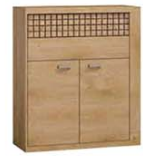
N6 102x40,5x118,5 cm opcja LED blat