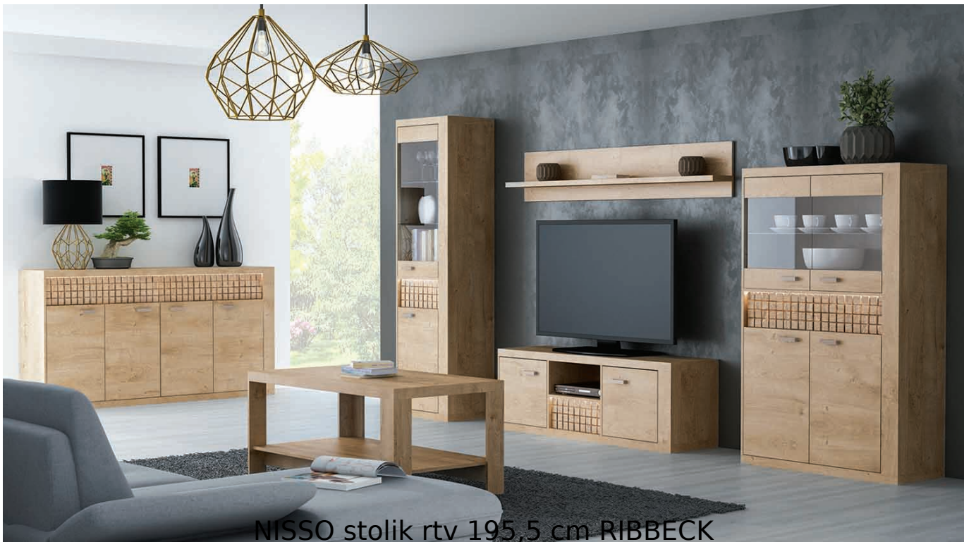
NISSO stolik rtv 195,5 cm RIBBECK

Stolik rtv 2-drzwiowy z szufladą o szerokości 195,5 cm należący do systemu NISSO. Możliwość dokupienia oświetlenia LED blat. Ultranowoczesny wygląd stworzonej kolekcji, to pomysł zarówno na salon jak i sypialnię. Połączenie prostoty kształtów oraz artystycznego akcentu dla lubiących bardzo innowacyjny wygląd w zestawieniu z praktycznością. Fronty szuflad dostępne w stylu NATURAL KRATKA lub NATURAL FALA. Meble pakowane w paczki, do samodzielnego montażu. Do kompletu dołączona przejrzysta instrukcja montażu. Produkt w 100% polski.