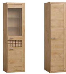
N4 57x40,5x200,5 cm opcja LED blat opcja LED półki N2 57x57,5x200,5 cm opcja trzech półek