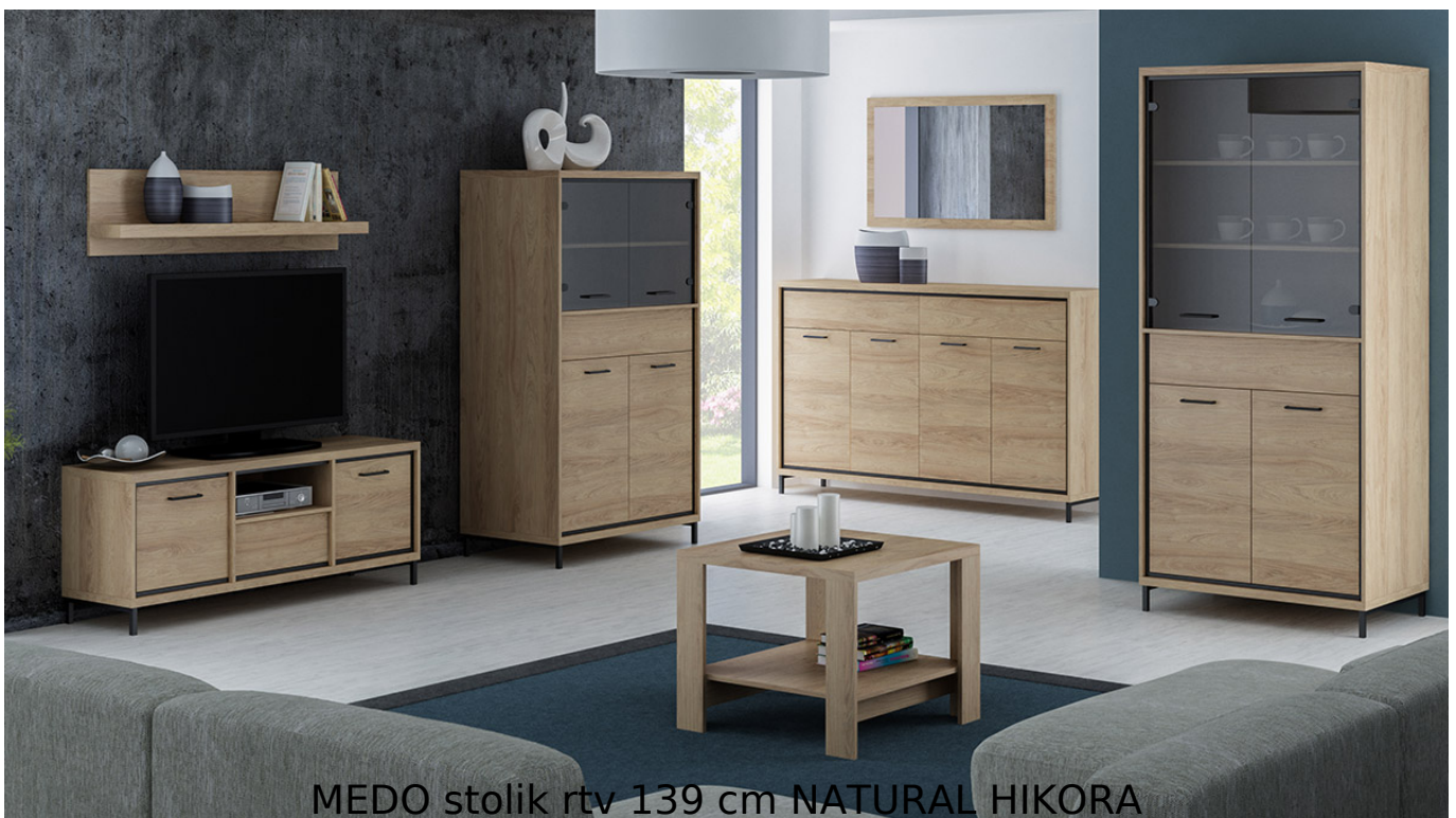
MEDO stolik rtv 139 cm NATURAL HIKORA

Prosty i funkcjonalny stolik rtv z szufladą o szerokości 139 cm należący do systemu MEDO. Możliwość dokupienia oświetlenia LED pod blat. ronty szuflad wykonane z drewna dębowego z charakterystycznym łupanym wzorem. Jasny kolor natural hikora dodaje ciepłego charakteru. Meble wykonane z wysokiej jakości płyty laminowanej o grubości 16mm, blaty pogrubione do 32mm. Obrzeża wykończone trwałą okleiną PCV. System posiada ramkę ozdobną w kolorze czarnym z MDF oraz system cichego domykania. Szuflady na prowadnicach kulkowych z pełnym wysuwem oraz funkcją "push to open". Całość zdobią metalowe uchwyty. Meble pakowane w paczki, do samodzielnego montażu. Do kompletu dołączona przejrzysta instrukcja montażu. Produkt w 100% polski.