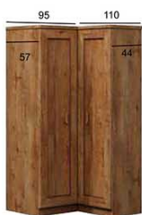
T25 KATALOG 95/110x57/44x190 cm (dostępna wersja odwrócona)