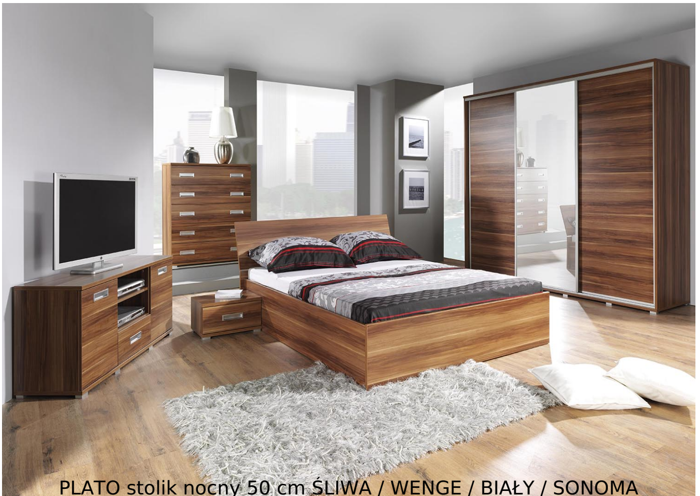
PLATO stolik nocny 50 cm ŚLIWA / WENGE / BIAŁY / SONOMA