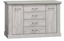
AP18 162x42x95,5 cm