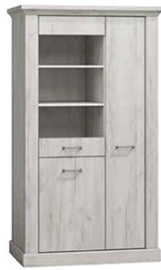
AP10 97x42x198 cm opcja LED półki