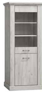
AP11 67x42x198 cm opcja LED półki