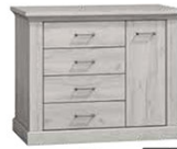
AP2 114x42x95,5 cm