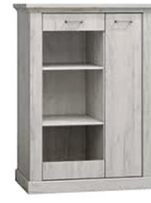
AP12 97x42x140,5 cm opcja LED półki