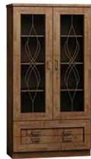
T8 90x44x190 cm