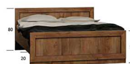
ŁÓŻKO T20 170x205 cm wymiar materaca 200x160