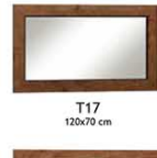
T17 120x70 cm