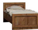
T21 100x205 cm wymiar materaca 200x90