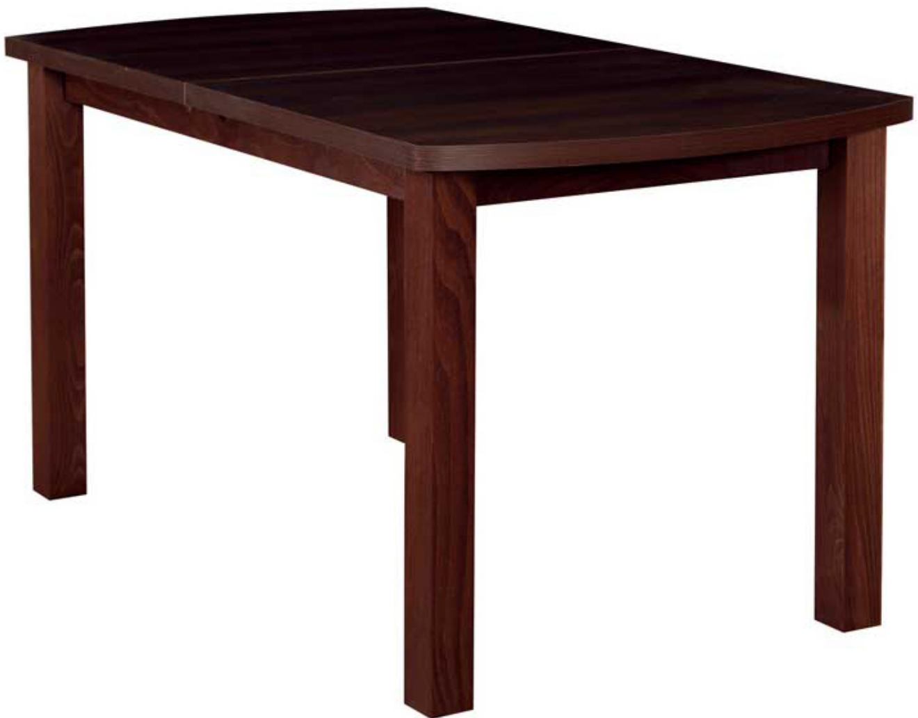
Stół rozkładany Rico 13 80x150 kolory