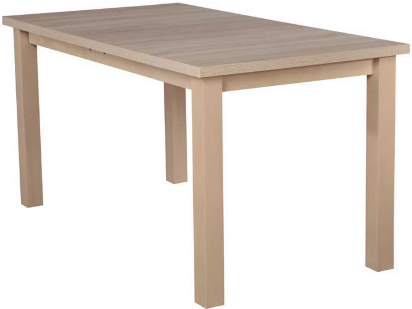
Stół rozkładany Rico 11 80x150 kolory