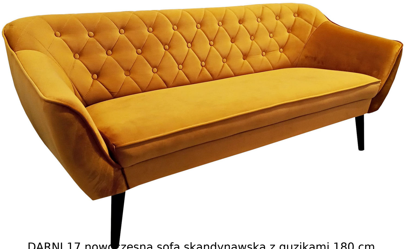
DARNI 17 nowoczesna sofa skandynawska z guzikami 180 cm