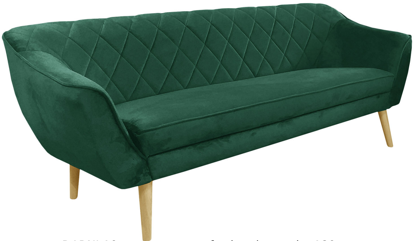
DARNI 10 nowoczesna sofa skandynawska 180 cm