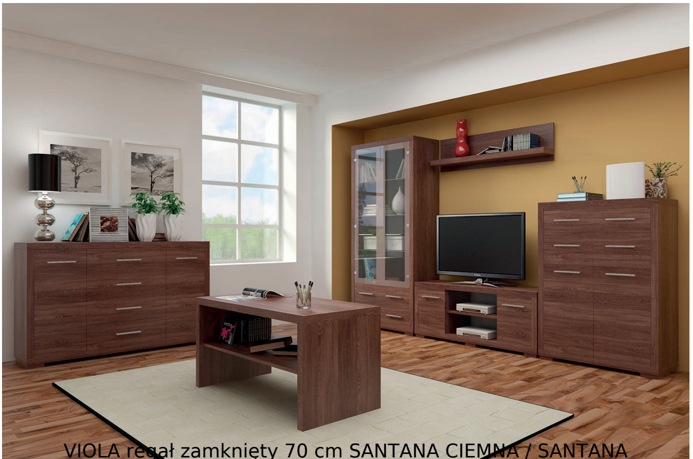
VIOLA regał zamknięty 70 cm SANTANA CIEMNA / SANTANA

Regał zamknięty 2-drzwiowy o szerokości 70 cm należący do kolekcji Viola. System jest idealnym rozwiązaniem dla każdego biura i salonu. Dzięki tej kolekcji możesz zaaranżować przestrzeń do pracy i odpoczynku w bardzo stylowy i funkcjonalny