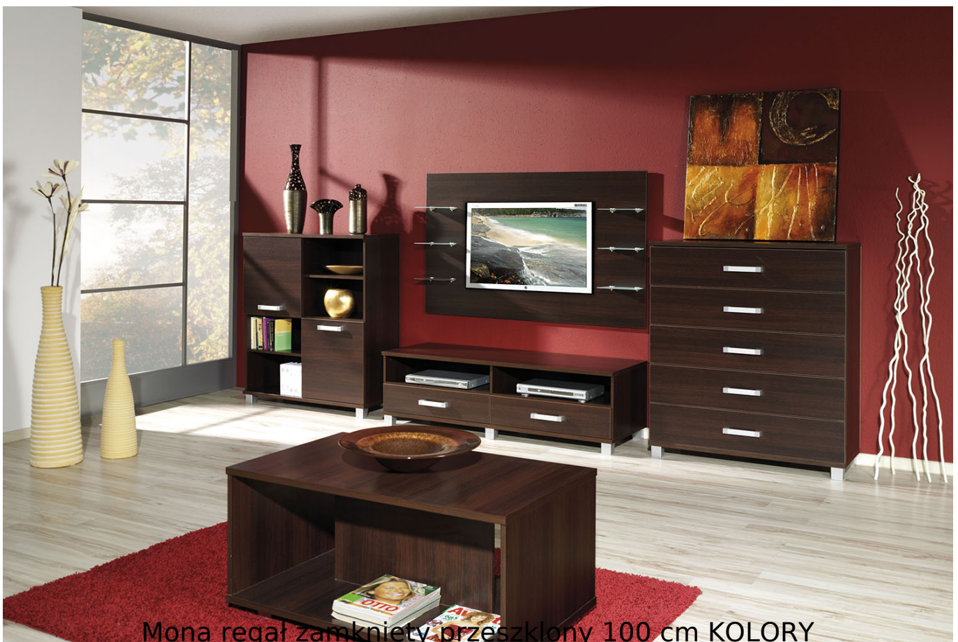
Mona regał zamknięty przeszklony 100 cm KOLORY

Regał zamknięty przeszklony z półkami należący do kolekcji Mona. Kolekcja mebli do salonu, sypialni oraz pokoju młodzieżowego. System dostępny w 4 kolorach (biały mat, wenge, śliwa wallis, dąb sonoma). Funkcjonalne rozwiązania