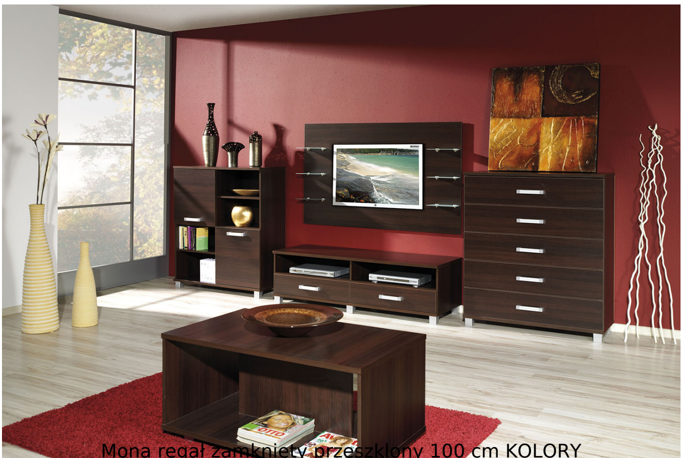
Mona regał zamknięty przeszklony 100 cm KOLORY

Regał zamknięty przeszklony z półkami należący do kolekcji Mona. Kolekcja mebli do salonu, sypialni oraz pokoju młodzieżowego. System dostępny w 4 kolorach (biały mat, wenge, śliwa wallis, dąb sonoma). Funkcjonalne rozwiązania