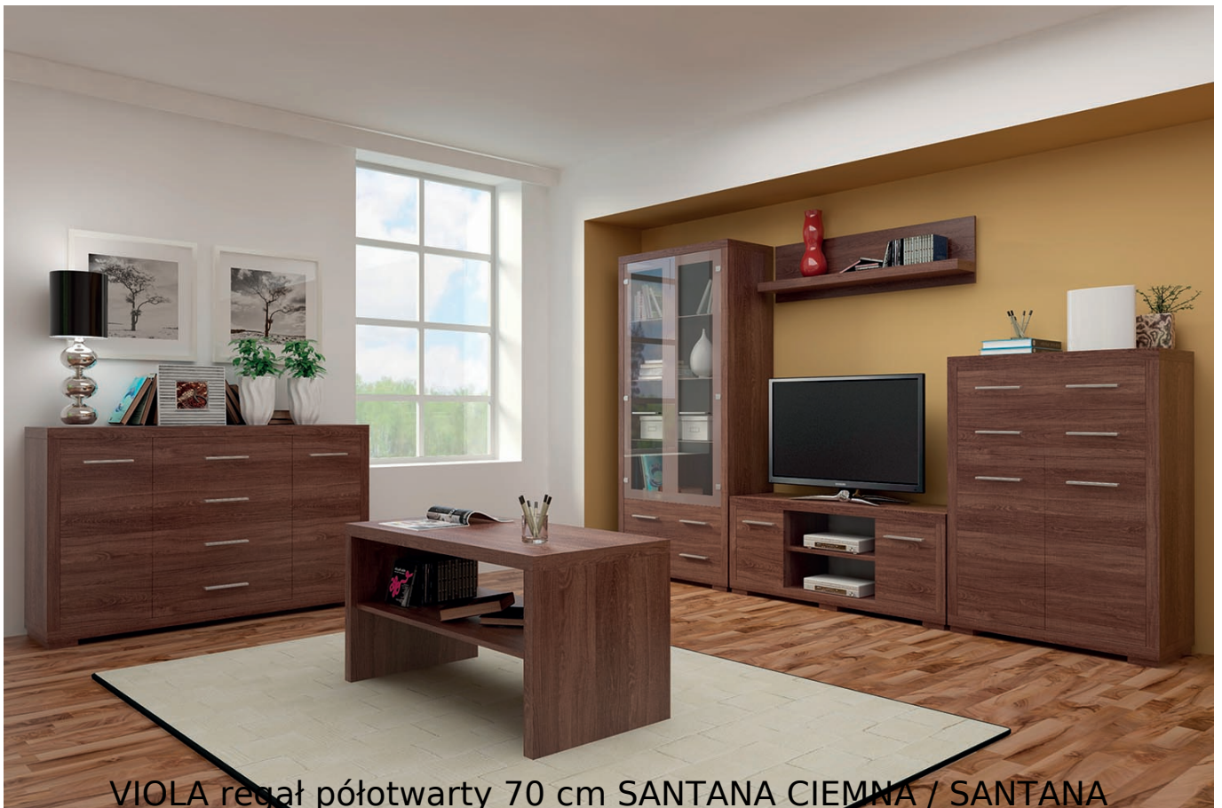
VIOLA regał półotwarty 70 cm SANTANA CIEMNA / SANTANA

Regał półotwarty 2-drzwiowy o szerokości 70 cm należący do kolekcji Viola. System jest idealnym rozwiązaniem dla każdego biura i salonu. Dzięki tej kolekcji możesz zaaranżować przestrzeń do pracy i odpoczynku w bardzo stylowy i funkcjonalny