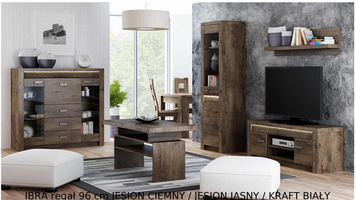
IBRA regał 96 cm JESION CIEMNY / JESION JASNY / KRAFT BIAŁY

Regał półotwarty 2-drzwiowy o szerokości 96 cm należący do systemu IBRA. Możliwość dokupienia oświetlenia LED blat do listwy ozdobnej. Zaletą systemu IBRA jest fakt posiadania sporej liczby elementów, które wchodzi w jego skład. Meble wykonane z wysokiej jakości płyty laminowanej o grubości 16 mm. Blaty pogrubione do 48 mm. Widoczna oraz wyczuwalna faktura drewna. Obrzeża oklejone ABS, odporne na wilgoć oraz ścieranie. Szuflady na prowadnicach kulkowych. Całość zdobiona metalowymi uchwyty. Meble pakowane w paczki, do samodzielnego montażu. Do kompletu dołączona przejrzysta instrukcja montażu. Produkt w 100% polski.