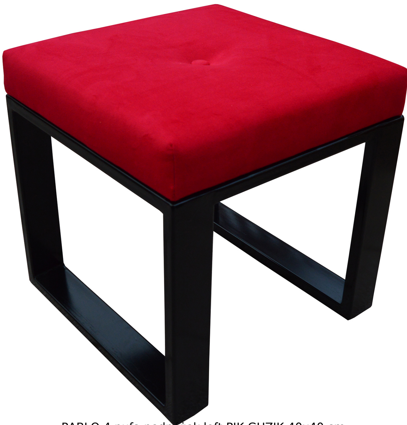
PABLO 4 pufa podnózek loft PIK GUZIK 40x40 cm

PABLO 4 to pufa podnózek do przedpokoju / salonu. Stylowa pufa doskonale sprawdzi się w nowoczesnych pomieszczeniach oraz będzie ciekawym dodatkiem w klasycznych wnętrzach. Siedzisko wykonane z wysoko elastycznej pianki T30, zapewniającej wysoki komfort użytkowania, stelaż metalowy malowany proszkowo. Cechą charakterystyczną jest pikowane siedzisko. Pufa dostępna w szerokiej gamie tkanin, do wyboru rodzaj. Produkt w 100% polski, pakowany w paczkę - nie wymaga montażu