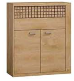
N6 102x40,5x118,5 cm opcja LED blat