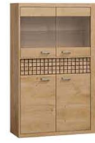
N5 102x40,5x199,5 cm opcja LED blat opcja LED półki