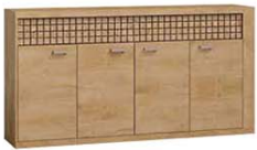
N9 191,5x40,5x99 cm opcja LED blat