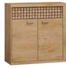
N7 102x40,5x99 cm opcja LED blat