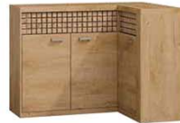
N15 132/95,5x40,5x99 cm opcja LED blat