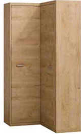
N14 87/109x53,5/40,5x200,5 cm