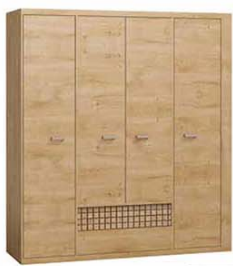
N3 195,5x57,5x200,5 cm opcja LED blat