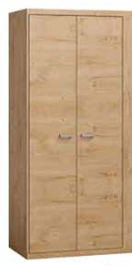
N1 102x57,5x200,5 cm opcja trzech półek opcja program