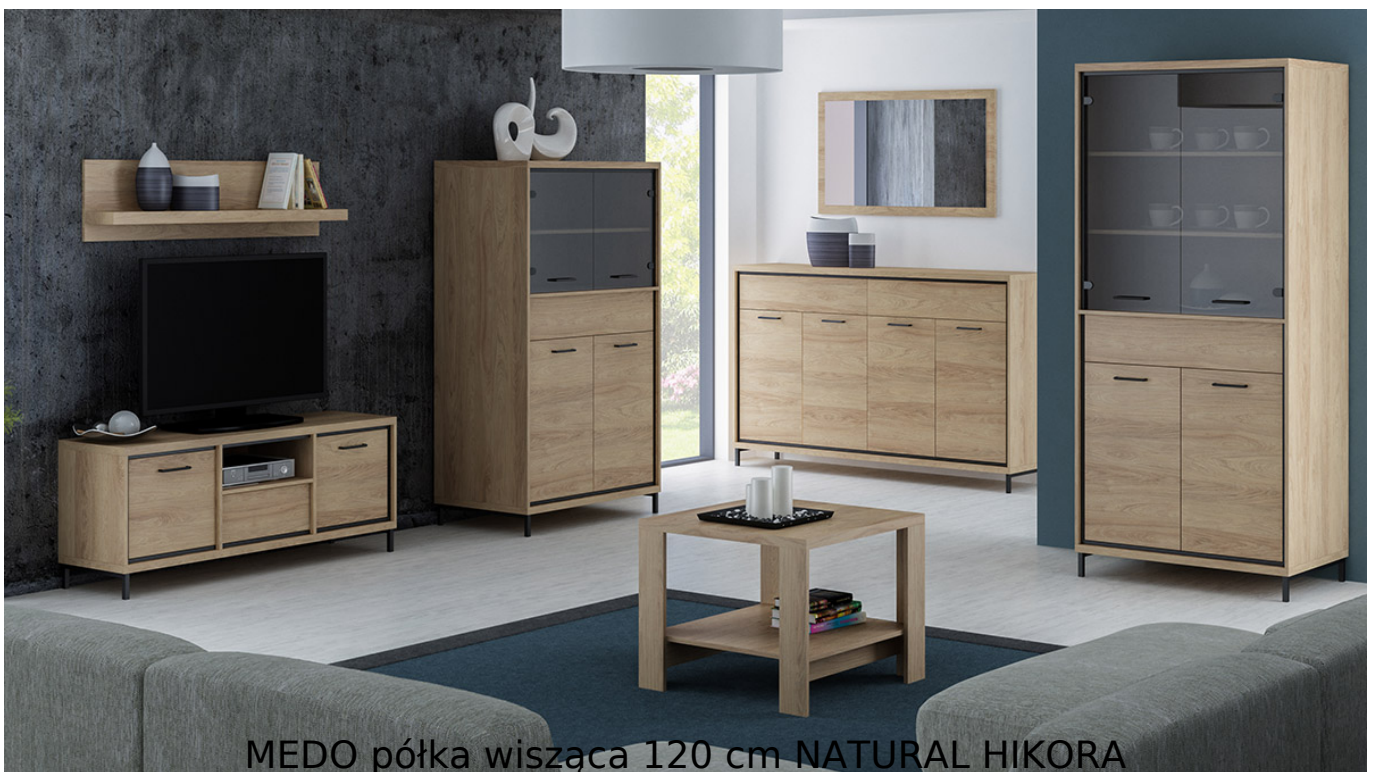
MEDO półka wisząca 120 cm NATURAL HIKORA

Półka wisząca o szerokości 120 cm należąca do systemu MEDO. Jasny kolor natural hikora dodaje ciepłego charakteru. Meble wykonane z wysokiej jakości płyty laminowanej o grubości 16mm, blaty pogrubione do 32mm. Obrzeża wykończone trwałą okleiną PCV. System posiada ramkę ozdobną w kolorze czarnym z MDF oraz system cichego domykania. Szuflady na prowadnicach kulkowych z pełnym wysuwem oraz funkcją "push to open". Całość zdobią metalowe uchwyty. Meble pakowane w paczki, do samodzielnego montażu. Do kompletu dołączona przejrzysta instrukcja montażu. Produkt w 100% polski.