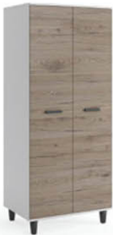
Szafa B7 80/183/56